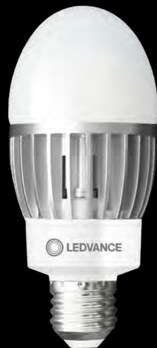
HQL LED P

Straßen, Flächenbeleuchtung, Fußgängerzonen, Parkanlagen